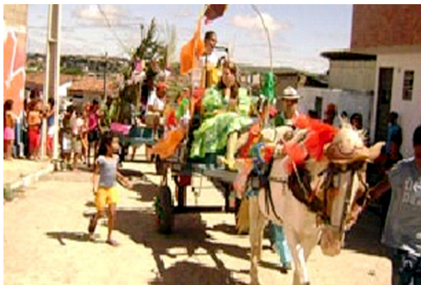
Imagem 06: Burreata nas ruas do bairro

Na época Junina, a escola realiza um desfile de carroças de burro, a “Burreata Neco Cirne”, a festividade faz parte dos festejos de São João da cidade. O evento é coordenado pelo diretor da escola e trouxe uma renovação cultural ao bairro. A “burreata” ocupa as principais ruas do bairro. Todas as carroças são ornamentadas pelos alunos e familiares.